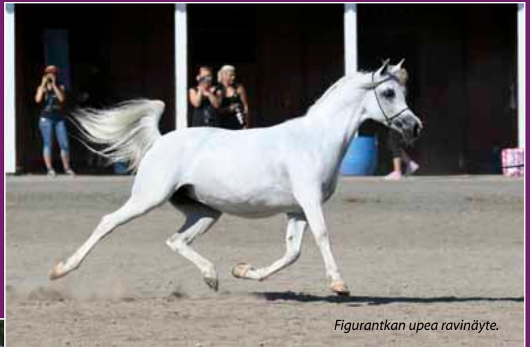
Figurantkan upea ravinäyte.