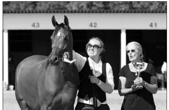
Shayera © Hanna Sinkkonen